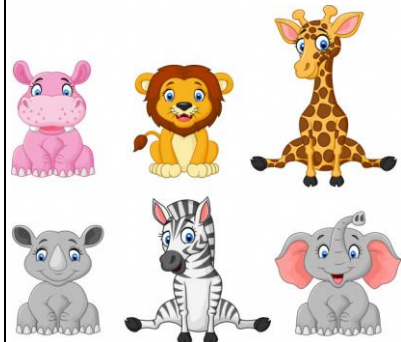
Een ander dier