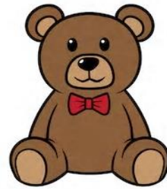
Een beer met een strikje