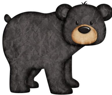
Een zwarte beer