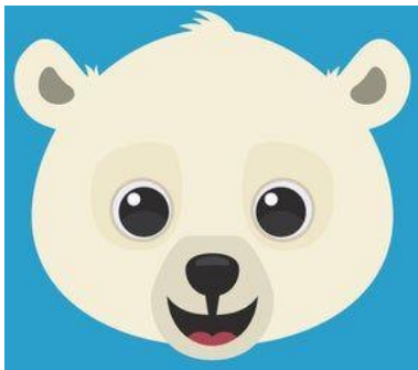
Een witte beer