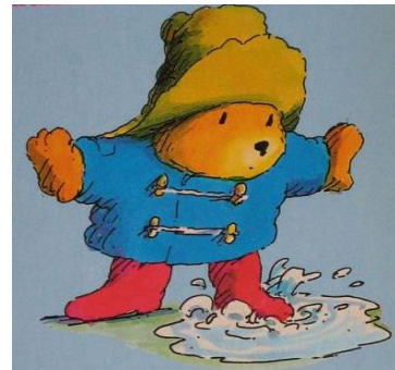
Een beer met kleren aan