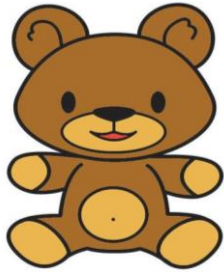
Een bruine beer

Kleur het rondje in als je de beer hebt gevonden.